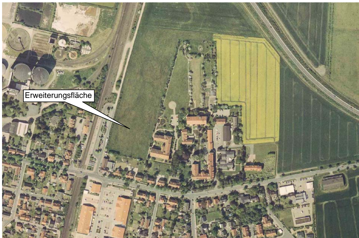
Luftbild vom Gelände der Grotjahn-Stiftung und seiner Umgebung (Stand: Mai 2006)

Die Erweiterungsflächen liegen im Einwirkungsbereich der Bahnanlagen und der Zuckerrfabrik auf der Westseite der Bahnanlagen. Aufgrund der geplanten Nutzung als Stellplatzanlage sind Immissionskonflikte nicht zu erwarten. Um deutlich zu machen, dass hier im Falle der Errichtung schutzbedürftiger Nutzungen Vorkehrungen gegenüber dem Bahnlärm