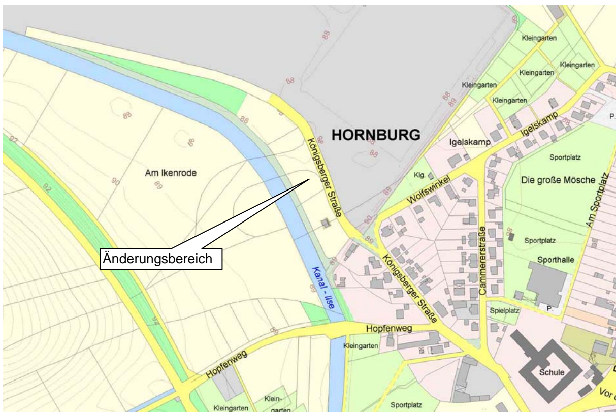
Ausschnitt aus der Amtlichen Karte 1 : 5.000 (AK5) – ohne Maßstab –

Die Fläche ist im wirksamen Flächennutzungsplan als „Fläche für die Landwirtschaft“ dargestellt. Es handelt sich um eine intensiv genutzte Grünlandfläche. Im südlichen Teil des Änderungsbereichs gibt es bereits ein kleines Stallgebäude. Die vorhandene Situation ergibt sich aus den folgenden Ausschnitten aus der Amtlichen Karte 1 : 5.000 (AK5) und aus dem Luftbild.