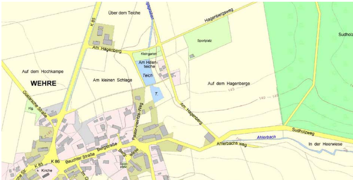
Ausschnitt aus der Amtlichen Karte 1 : 5.000 (AK5) – ohne Maßstab –