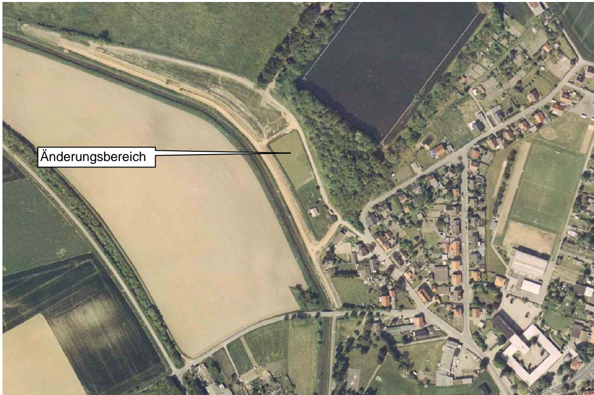
Luftbild vom Änderungsbereich und seiner Umgebung (Stand: Mai 2006)

Die Flächen im Änderungsbereich liegen am Rand des neu berechneten und vorläufig gesicherten Überschwemmungsgebiets der Kanal-Ilse. Mit einer Überflutung des Geländes ist daher nicht zu rechnen.